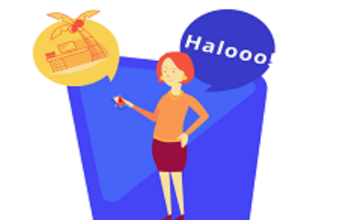
Kontakt z kontrahentem nieodpowiedni dla transakcji