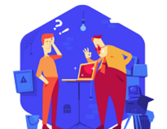
Brak oznak prowadzenia działalności gospodarczej