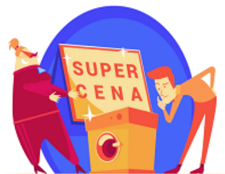
Cena nierynkowa bez uzasadnienia