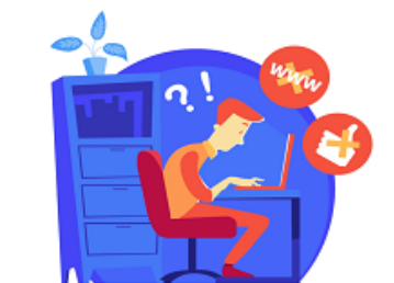
Brak strony www lub social mediów