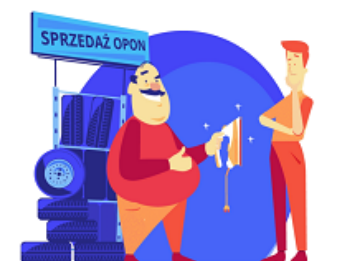
Zmiana branży kontrahenta bez uzasadnienia