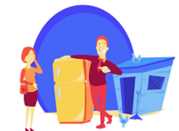
Brak zaplecza organizacyjno-technicznego